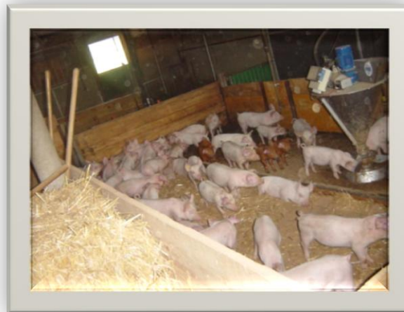
Eine der 3 Jagerbuchten

Nach etwa 5 Wochen ab der Geburt der Ferkel werden diese von der Muttermilch abgesetzt und kommen alle zusammen in die Buchten des Jagerstalls in dem sie zuerst an das Futter gewöhnt werden.