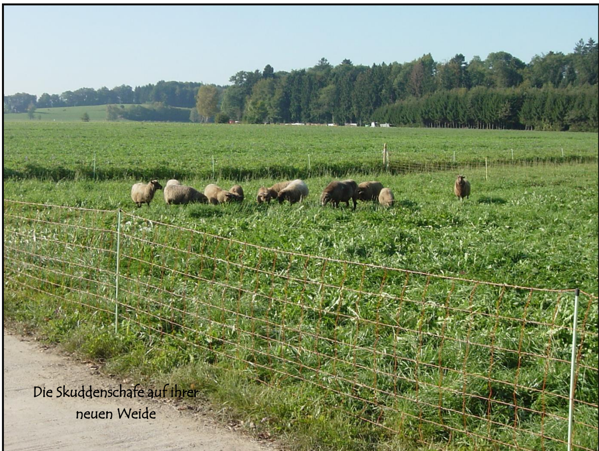
Die Skuddenschafe auf ihrer neuen Weide

Dann heisst es wieder neue Zäune aufstellen. Auf der Weide haben die Schafe als Unterstand einen grossen Zirkuswagen.